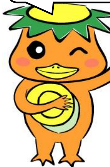
港区リユースキャラクター リユース助